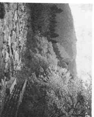
▲白い花は桜、その後ろ桃 物ばかり。飛騨牛の焼き肉、イロナ

明宝村は、観光とともに産業にも力をいれていて、知名度あるおしい特産品が多い。「明宝ハム」をはじめ、自然の恵みをたいせつにした物ばかり。飛騨牛の焼き肉、イロナ