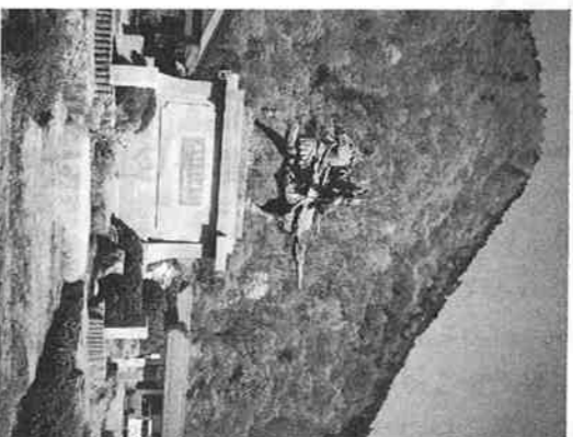
▲道の駅明宝 刻まれる。

有名な二つの街の中間にあつて、明宝村の自然は、四季が変わる度に大きく表情を変え。華やかに花々が咲き乱れる春、山